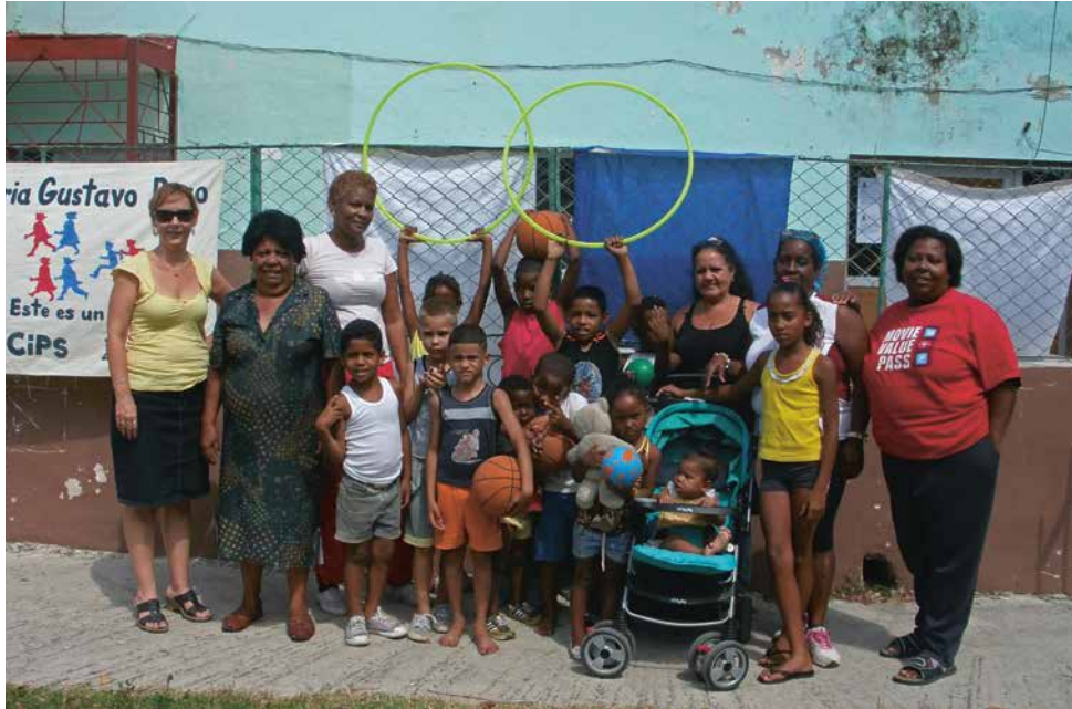
Immer gut besucht und ein Ort des Austauschs – die Spielnachmittage

Seit 2012 werden die positiven Erfahrungen, die mit dem Zunzún-Projekt «Sport im Quartier» in Havanna seit 2006 gemacht werden, nun in anderen Quartieren Havannas und weiteren Provinzen Kubas repliziert: Interessierte, welche in ihren Heimatgemeinden Sport- und Spielangebote anbieten möchten, können sich in Workshops die dafür nötigen Kenntnisse und Fähigkeiten aneignen.