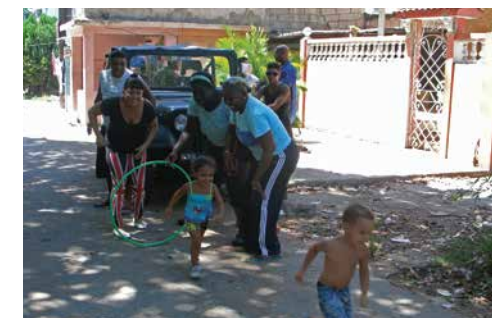
Spass mit Reifen – und alle machen mit! Seit über zehn Jahren läuft das Projekt in «La Timba» schon, einem Quartier in Havanna, in dem besonders viele benachteiligte Kinder und Jugendliche leben.