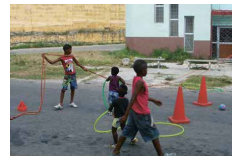
Beim Aufbau helfen die Kinder mit, die Vorfreude ist gross und die Spielnachmittage gut besucht.