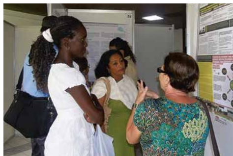
Teilnehmerinnen in regem Austausch

Mit den diesjährigen Beiträgen griff das CIPS Veränderungen auf, die international von Bedeutung sind: nachhaltige Entwicklung auf lokaler Ebene, Gouvernanz-Fragen, sozialverträgliches Wirtschaften, interne und internationale Migration sowie gesellschaftlicher Wandel. Die vier Podiumsdiskussionen, über achtzig Vorträge und Poster-Präsentationen trugen der Komplexität der Veränderungen, die sich international verzeichnen lassen, Rechnung. Thematisiert wurden zudem neue Formen elektronischer Kommunikation, die in den letzten Jahren auch in Kuba an Bedeutung gewonnen haben. Diskutiert wurde die elektronische Kommunikation via Email und soziale Netzwerke, die durch die Einrichtung öffentlich zugänglicher Hotspots nun auch vermehrt in Kuba Einzug gehalten hat. Kritisch angemerkt wurde die digitale Kluft, die sich auch in dem karibischen Land bemerkbar macht: Die Bedeutung des Internets hat zugenommen, vor allem auch in Bezug auf wirtschaftliche Betätigungen im Bereich des Tourismus – ohne Internetzugang ist es schwierig, wettbewerbsfähig zu bleiben.